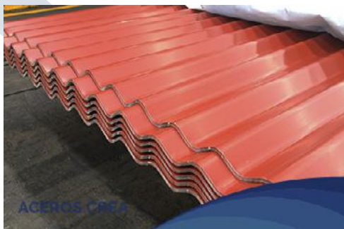
Lámina de gran aplicación en la instalación de muros, techos y bardas para la industria de la construcción. Cubiertas con vertientes no mayores a 15 m y pendiente mínima del 10%. Cubiertas curvas mediante comado previo.