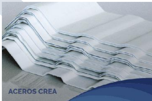
Lámina termoacústica de PVC Tricapa está compuesta por dos capas de polímero y una capa de aislante, la capa central color gris está constituida principalmente de PVC y micro burbujas de aire, las capas del exterior se componen de PVC en color blanco con aditivos de alta tecnología.